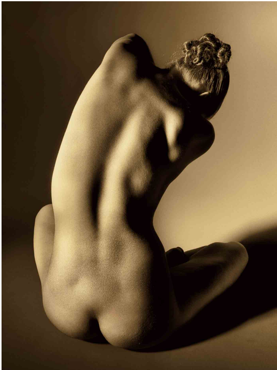
「オブジェとしてのヌード」 HJPI320100002603