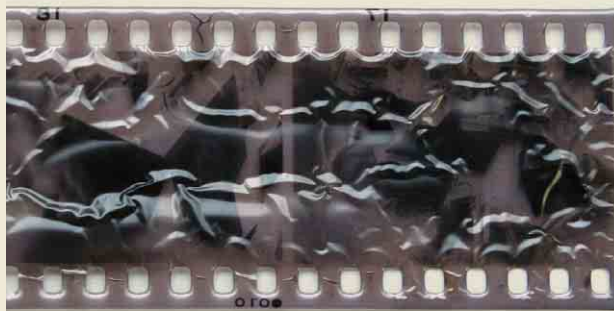
ビネガーシンドローム

またフィルムを納めている包材がプラスチック製のものでは、フィルムがクルクルと丸まって引伸機でのプリントができなくなることもあります。