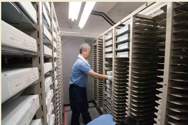
相模原フィルム収蔵庫内部

保存センターではフィルムに写っている情報を、すべて高精細で読み取ってはいません。センターでは、35ミリフィルムは原則として800dpiでスキャンしています。この程度ですとキャビネサイズ