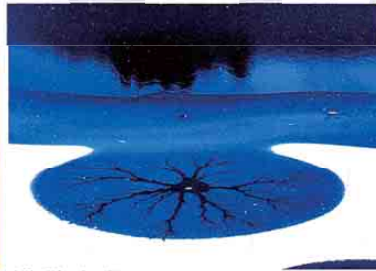
土井 明治 冬の湖面