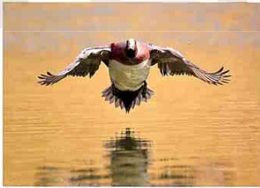
中田 一真 ヒドリガモの飛翔