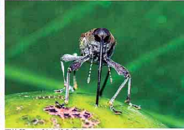
栗林 慧 ツバキシギソウムシ