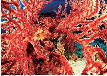
横山 和男 カサゴ