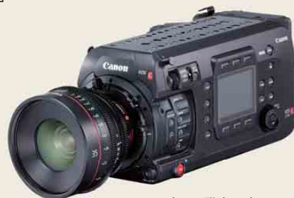
2017年7月発売予定の Canon EOS C700 外観こそ違うものの、産み出される写真は一眼レフと同じものだ。